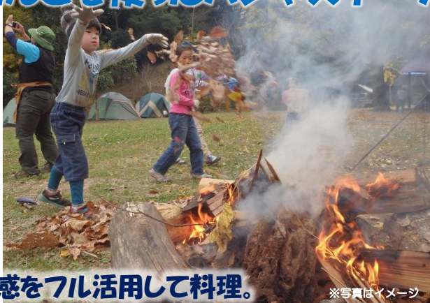
五感をフル活用して料理。 ※写真はイメージ

たき火は、子どもを魅了する不思議なちからがあります。そんなポカポカの火を使って、お外でスイーツを作っちゃおう。